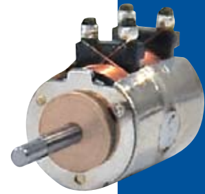
PM Type Motors